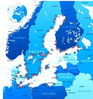
Sverige, Finland, Ryssland, Estland, Lettland, Litauen, Polen, Tyskland, Danmark