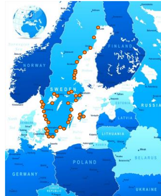
Intervju 2005 40 hamnar i Sverige