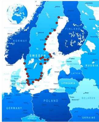
Intervju 2009 30 hamnar i Sverige